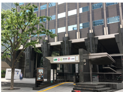
新宿マインズタワー正面およびA1出口