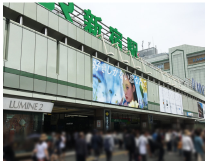
Shinjuku station South Entrance (Exit)