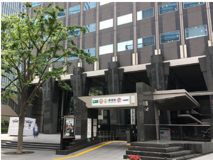
Shinjuku MAYNDS Tower, Shinjuku St. A1 Exit