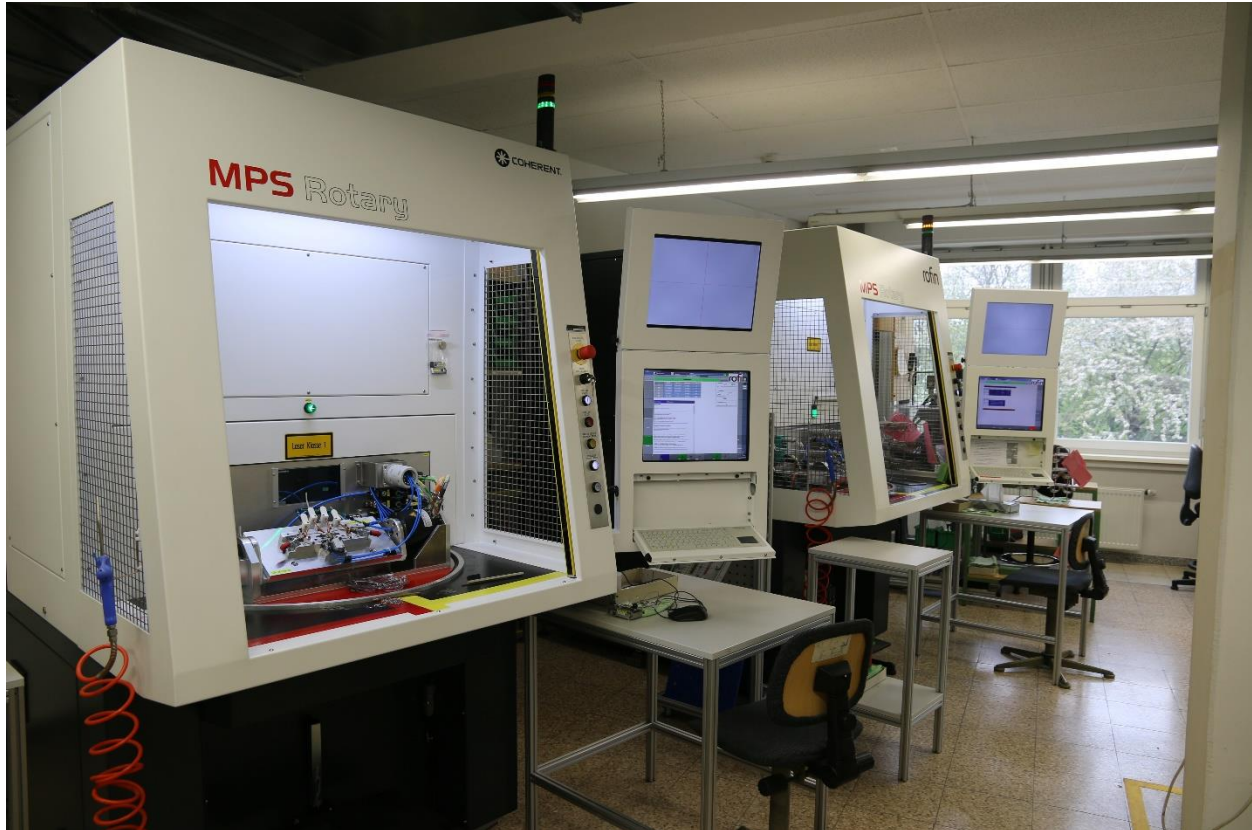
Zwei MPS Drehtelleranlagen zum Laserschweißen von Brillen in der Produktion bei Silhouette in Linz, Österreich